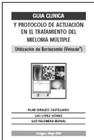
Portada de uno de los trabajos del Dr. Palomera

res hematopoyéticos del Hospital, realizando el primer procedimiento de trasplante en Aragón ese mismo mes. Posteriormente ha trabajado en el diagnóstico y tratamiento de enfermedades de la sangre