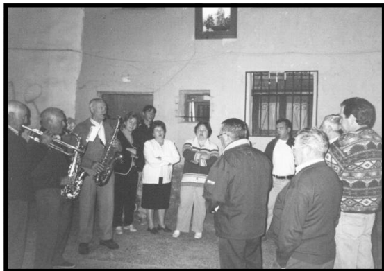
Aurora de San Pascual. Año 2002

Para el cofrade, el día de San Pascual, comienza muy temprano, pues a las 6 de la mañana es La Aurora, desde la calle de la Virgen del Rosario, junto a la Hornacina, en la que cada año es cantada por las hermanas que les toca por riguroso orden de lista, aunque son muchos los que se apuntan de forma voluntaria.