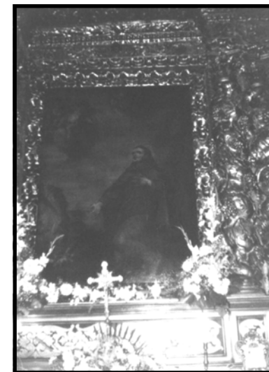
Altar de S. Pascual

A partir de 1977, las mujeres acudían a la merienda, cosa que hasta esta fecha no hacían, y en el capítulo correspondiente se aprobó que pagaran las mismas cuotas que los hombres. En el capítulo del año siguiente se aprobó que las mujeres salieran a cantar la Aurora.