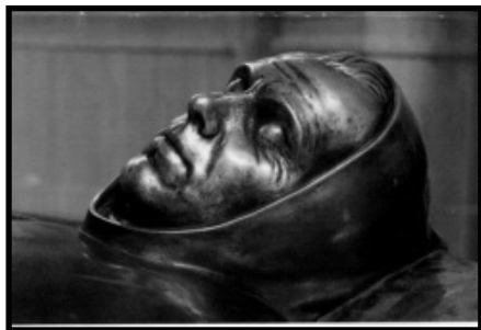
Sepulcro de S. Pascual en Villareal

Fue beatificado por el Papa Pablo V el 19 de Octubre de 1618. Canonizado por el Papa Alejandro VIII el 16 de Octubre de 1690. Santo Patrono de todas las Asociaciones y Congregaciones Eucarísticas por León XIII.