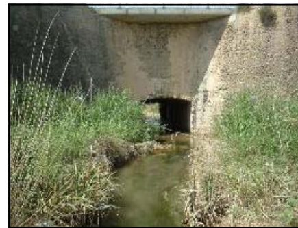
Puente de la Marga

Una de las grandes rutas (GR) nacionales que cruzan por nuestro término municipal es el Camino Jacobeo del Ebro . Llega desde Gallur por los términos agrícolas, y continúa hacia Navarra siguiendo la carretera que pasa por todos los pueblos de la ribera. Una serie de flechas amarillas indican su itinerario. Proponemos su recorrido partiendo desde la Avda. de Zaragoza por el camino Ancho –antigua calzada romana-, cruzando el nuevo polígono industrial El Zafranar en busca del Canal Imperial, que atravesaríamos por el Puente de Valverde. Llegados a este punto, la bifurcación de caminos permite dirigirnos, por la izquierda, hasta los términos de “la India” y las riberas del río Ebro, en tierras de Novillas. Si continuamos hacia Levante, pasada la harinera que allí mismo se encuentra, las indicaciones amarillas nos muestran el camino que viene desde Gallur atravesando los campos agrícolas, que sigue en paralelo al Canal Imperial. Tenemos la opción de seguir hasta la población vecina (o llegar hasta mitad de recorrido), y volver por el cajero del Canal hasta el Puente de Valverde, en un agradable paseo donde se divisa a nuestros pies toda la huerta de las tier-