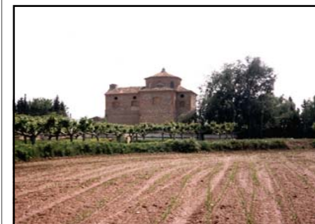
Ermita del Puy

El primer y principal paseo del que Mallén se siente muy orgulloso es el que lleva hasta la ermita de la Virgen del Puy, por eso se le conoce como Paseo del Puy . Fue construido en 1832. Comienza en el cruce del Cantón, y tiene 1 km aproximado de longitud. Está totalmente embaldosado, y dispone de bancos a lo largo de todo el recorrido. El entorno de la ermita tiene un magnífico parque para el disfrute del paseante.