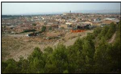
Vista de Mallén

En este número proponemos una serie de rutas o circuitos por los alrededores de Mallén, que de seguro serán del agrado del paseante, y le ayudarán a descubrir nuestros parques, nuestros ríos y canales, y contribuirán a conocer mejor nuestra querida villa.