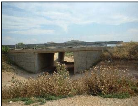
Puente de la autopista

al Parque-Mirador de Las Delicias ubicado en el llamado “monte de la horca”, donde también se encuentran los antiguos depósitos de agua potable que abastecía a la población. Desde este punto se divisa una magnífica panorámica de todas las huertas del valle de la Huecha, la “muela” de Borja, y toda la sierra del Moncayo, además de un buen número de pueblos de la zona. A sus pies se encuentra un circuito permanente para la práctica del motocross. Siguiendo por el citado “camino viejo” de Zaragoza, también camino de cabañera para el tránsito de los ganados, dejaremos el cementerio de Mallén a la izquierda, y enseguida nos toparemos con una ruptura brusca, un corte transversal que supuso la construcción del Canal de Lodosa, que nos obliga a dar un giro de 90° en dirección Sur. El camino seguirá paralelo hasta la autopista vasco-aragonesa, que vuelve a condicionar la ruta. Desde ese cruce de caminos, tenemos la alternativa de cruzar el Canal de Lodosa para seguir hasta la Carretera Nacional N-232; pasar el puente de la autopista para continuar hasta Burrén y Burreña; o seguir en un nuevo giro hacia Poniente, hasta enlazar con el camino de Magallón y retornar a la villa. También podemos continuar en paralelo a la autopista hasta el camino de Barosa , que lleva a la ermita del Puy, o proseguir