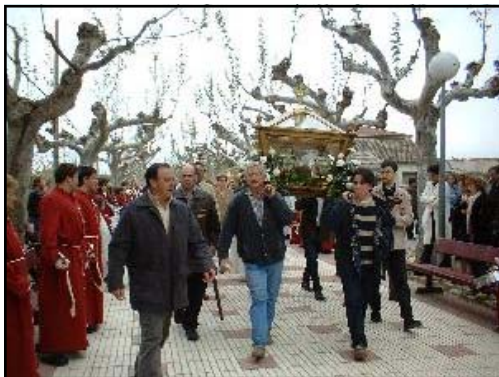
Entrada del Cristo Yacente a la ermita del Puy el Domingo de Resurrección.

La fiesta del Puy ha sido siempre una fiesta de barrio, y cuando éste no existía, de cofradía. Tras las fiestas del Cristo, que hasta hace muy poco terminaban el jueves, los malleneros esperaban ansiosos que llegara el fin de semana siguiente, para acudir a la fiesta y verbena organizadas en el paseo o en su entorno. En la actualidad estas fiestas se han fundido con las del Cristo, dando como resultado los nueve días de las Fiestas Mayores en Mallén, desde el primer domingo de septiembre (Vísperas del Cristo) hasta el segundo domingo del mismo mes (Día del Puy).