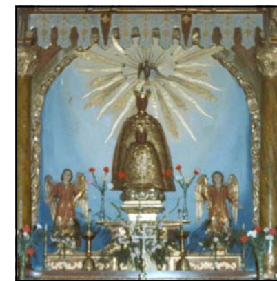
Virgen del Puy de Mallén

En 1969 un cofrade regaló una imagen de la Virgen del Puy, la que hoy en día se venera en su baldaquino de la ermita, copia de la del Puy de Francia, ya que la que hasta entonces se veneraba era una madona con niño de tez blanca que puede verse a la derecha del altar. De la imagen anterior a ésta, no se sabe qué fue de ella , aunque sí se sabe que era también de tez morena, igual que la francesa, como puede verse en un limosnero de madera que se conserva de la primera mitad del s. XVIII y en el lienzo que representa el milagro. A diferencia de la francesa, manto y cuerpo son una sola pieza, mientras que la francesa es una imagen sentada sobre una cátedra con el niño sobre su regazo, detalles que son imposibles de apreciar en las dos , pues la del Puy francés también se encuentra cubierta con un manto en este caso de tela. La anterior imagen morena que desapareció, según el padre Faci era una estatua bulto, es decir, que había que cubrirla necesariamente por un manto pues carecía de cuerpo. La medalla de los cofrades es un óvalo en cuyo anverso