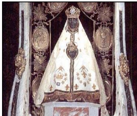
Virgen del Puy de Francia

Ya a partir de 1900, la cofradía quedó encargada de custodiar una nueva imagen del Cristo Yacente, de su adorno y su limpieza. Así como de trasladarla de la ermita a la iglesia el Jueves Santo por la noche, para que al día siguiente acompañase a los demás pasos en la procesión del Santo Entierro del Viernes Santo.