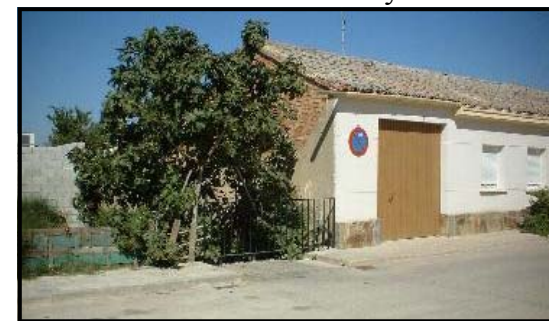
“La Caña” separa El Portal de la Urbanización “Los Sauces”

Las calles de este barrio son anchas y cómodas, tanto para el viandante como para el automobilista. Es un barrio tranquilo, periférico, alejado del centro de la villa y del bullicio que genera toda actividad relacionada con el comercio y el ocio.