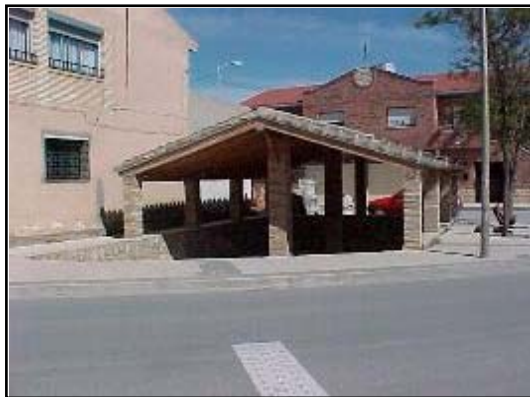
El lavadero, calle La Fuente

rrio allá en la década de 1930, junto con la calle La Fuente , que recordaba el camino que llevaba hasta el manantial a los pies de la ermita, a la vez que servía de carretera en dirección a los municipios de Fréscano y Borja.