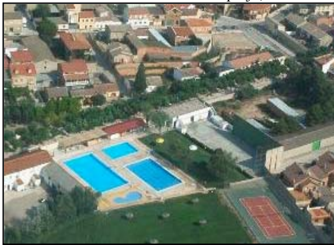
Vista aérea de la zona del Puy

La expansión urbana de Mallén motivó la creación de nuevas calles en los años 70 y 80, como San Jorge (1982) y La Jota (1982), enlazando con el barranco que baja desde el monte de “La Horca”, hoy completamente urbanizado y convertido en calle de Fr. Jerónimo de San José (1987). Este conjunto de calles está formado por viviendas unifamiliares. En 1990 se dio el nombre de Virgen del Puy a dos calles de una nueva urbanización, junto al complejo municipal de deportes, paralelas al paseo por su lado izquierdo, ocupando parte del camino Barosa. En el citado complejo, construido