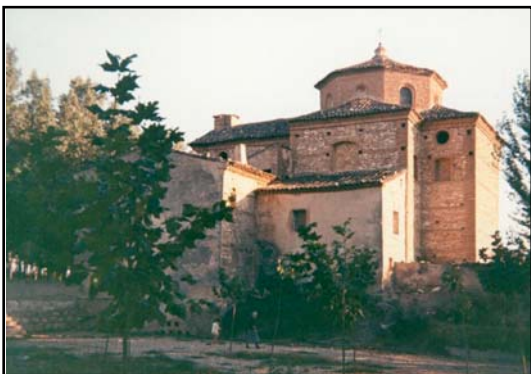
Ermita del Puy

S iguiendo con nuestras entregas sobre las calles y los barrios de Mallén, en esta ocasión nos hemos centrado en el “barrio del Puy”, un barrio cuya arteria principal es el paseo que lleva hasta la ermita de N a S a del Puy, imagen muy querida en Mallén desde la Edad Media. En su conjunto es un barrio muy joven; las primeras calles no tienen el siglo de existencia, y la gran mayoría son de finales del siglo XX. Casi todas las casas son de tipo unifamiliar o “adosados”, muy en boga en la actualidad, dando un carácter residencial al barrio, y una imagen de prosperidad al pueblo de Mallén.