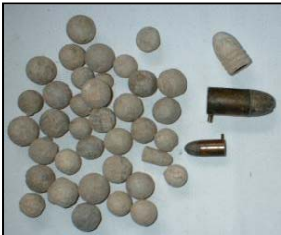
Munición encontrada en Mallén de la Guerra de Independencia

Las tropas aragonesas, ante la noticia de la salida del ejército francés de Pamplona se desplazaron hasta las inmediaciones de Tudela, donde intentó recabar aliados. Después de una intensa batalla en la población Navarra, las tropas aragonesas se vieron obligadas a retroceder hasta Mallén debido al fuerte empuje de las tropas francesas. Mallén era la primera plaza aragonesa, en la ruta hacia Zaragoza, que los franceses tenían que conquistar. Por lo tanto el combate entre las huestes aragonesas y las francesas en Mallén era vital. Si ganaban el ejército maño las tropas de Napoleón sufrirían una derrota vital y truncaría sus planes de hacerse con una ciudad estratégicamente importantísima para dominar el resto de las tierras españolas, si por el contrario era