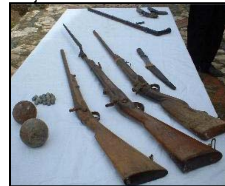
Distintos tipos de armas de la época

En un último y desesperado intento por evitar la caída de Mallén, el marqués de Lazán intentó mantener el orden y procuró también que sus hombres continuasen firmes en sus posiciones. El resultado fue fútil, ya que los fusileros huyeron abandonando el campo y Lazán a duras penas pudo llegar al río Ebro para huir en un barquichuelo. Mallén había sido conquistada por el ejército francés.