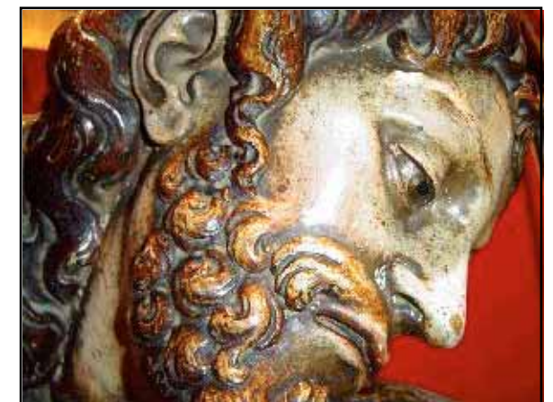
Rostro del Santo Cristo

En los acontecimientos especiales, como es el caso de este año, se saca en procesión la imagen titular, hecho que no ocurre desde el año 1999, y anteriormente desde 1949. Casualmente, en estas dos procesiones tuvo lugar una fuerte tormenta acompañada de abundante granizo.