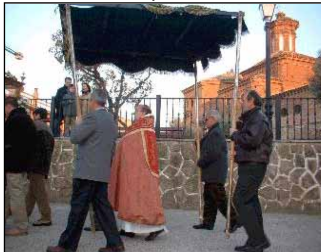
El día de Viernes Santo con el Palo negro

Además de contar con unos cargos fijos: presidente, secretario, tesorero y 2 vocales.