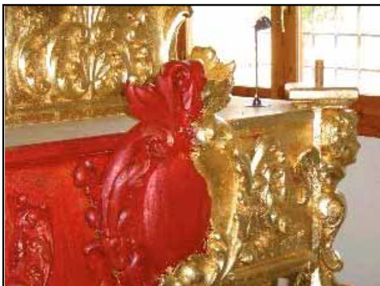
Durante este año se ha restaurado la Peana del S. Cristo

La Cofradía del Santo Cristo se fundó el 14 de mayo de 1854, según consta en su libro de actas, aunque los estatutos ya estaban redactados en 1849, año de terminación de las obras de la nueva Capilla, que debía albergar la imagen del Santo Cristo.