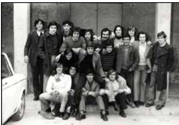
Talla de Quintos. Año 1974

En este contexto, queremos resaltar cuales son las principales fiestas que se celebran en Mallén siguiendo el ciclo de las estaciones del año, pero centrándonos de momento en el ámbito religioso, sin olvidar otro tipo de celebraciones “paganas” como los carnavales, “jueves lardero”, o la “talla y salida de quintos”.