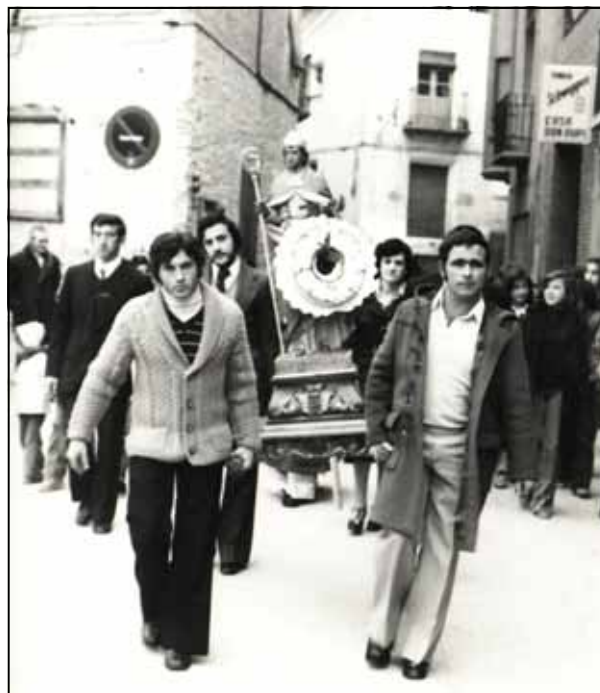
Procesión de San Blas. Año 1978

Su fiesta se celebra el 3 de febrero. Actualmente existe una cofradía muy antigua que lleva su nombre, y que se encarga de mantener la devoción a este obispo y mártir armenio, protector de las dolencias de garganta, muerto el año 316. Las celebraciones empiezan el día 2 con las “vísperas”, seguidas