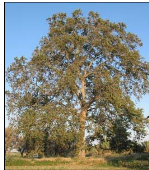
Platanero de Valverde

D esde siempre el hombre ha sentido admiración y respeto por todo lo que se sale de lo corriente en la naturaleza, como no, por los grandes árboles. No podemos decir que en nuestra comarca sea común ver grandes ejemplares, pero por ello es si cabe más interesante y admirable el que se conserven algunos, y