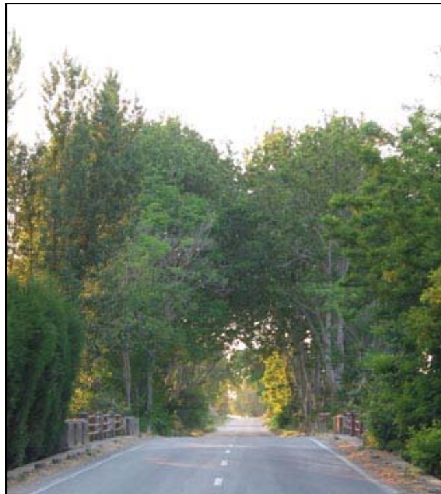
Platanero carretera de Tudela

El plátano de sombra pertenece a la familia “ Platanaceae ” son árboles de hoja caduca que tienen como cualidad principal el que su corteza se exfolia en placas, dando a su tronco un aspecto multicolor característico.