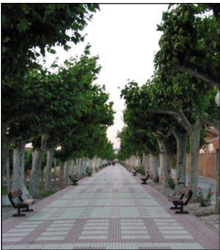
Platanero del Paseo del puy

En nuestras manos está que las próximas generaciones puedan disfrutar de estos árboles, y ojalá, que ellos sepan cuidar e incluso aumentar el gran número de árboles con que contamos en Mallén.