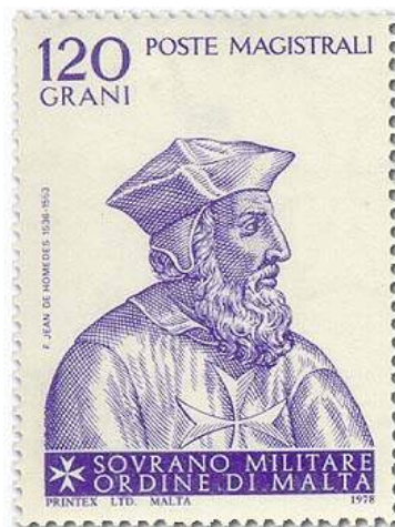
Juan de Homedes . Gran Maestre desde 1536 a 1553. Nació en Aragón

E l largo período de siete siglos que la Orden de San Juan estuvo asentada en Mallén, ha quedado resumida y terminada en esta segunda entrega -la primera en el nº 21-. Evidentemente aquella sociedad de costumbres feudales desapareció con la evolución hacia ideologías más abiertas y liberales en el siglo XIX, pero su importancia estriba en marcar una prolongada etapa de la historia conocida de Mallén, que empezaría en la Reconquista y duraría hasta los inicios de la Edad Contemporánea, sin olvidar que, con toda probabilidad, Mallén fue la primera sede de las posesiones hospitalarias en los reinos de la Corona de Aragón y Navarra