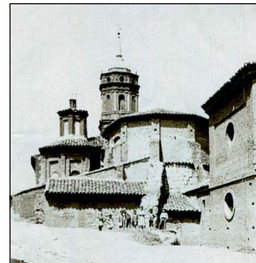
Iglesia de Mallén en 1903

También conocemos el estado que manifestaba la parte posterior de la iglesia, gracias a una fotografía antigua de principios del siglo XX. En ella se puede ver perfectamente el ábside de la iglesia con dos de sus periodos constructivos: la parte inferior realizada en piedra sillar, y la superior elevada en ladrillo. Apoyando directamente sobre el ábside, es muy interesante observar la existencia de un fragmento de la muralla del antiguo castillo de la villa, lo que nos pone en la pista de una nueva característica apenas analizada, que es la utilización del edificio de la iglesia como un elemento más del recinto defensivo de Mallén.