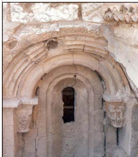
Ventana románica exterior

Otro elemento que se descubrió fue una cruz enmarcada en un círculo, que se encuentra labrada en uno de los sillares del muro. Su estado de conservación impide hacer un comentario más profundo, ya que la parte inferior de la misma ha