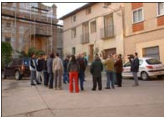
Aurora de San Pascual

En la madrugada del 17 de Mayo, los miembros de la cofradía de San Pascual en Mallén recorren las calles del pueblo cantando la aurora dedicada a este santo. Los cofrades disfrutaban en este día de una deliciosa comida, ya que poseen su particular receta de carne a la pastora .