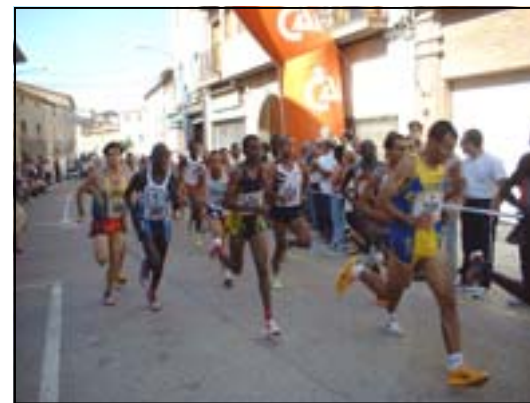
Año tras año el nivel de “La Joya” va aumentando, convirtiéndose en una prueba internacional

el jueves y el viernes los niños iban a la escuela. Pero lo hacían con muchas ganas porque sabían que las fiestas volvían de nuevo el fin de semana, en esta ocasión en honor a la Virgen del Puy. Se celebraban diversos actos en el entorno del paseo. Antiguamente, todos los actos (no sólo los religiosos) eran organizados por la cofradía de la Virgen del Puy. Uno de ellos era la tradicional carrera pedestre de “la Joya”, acto que todavía hoy tiene lugar el día del Puy. En un principio ese día era el 8 de Septiembre (Natividad de la Virgen) pero se cambió al segundo domingo de Septiembre para evitar que coincidiese con las Fiestas del Cristo. Hoy en día esta fiesta se ha fusionado con las del Cristo. En el día del Puy, la Misa Mayor se celebra en la ermita, y en alguna ocasión se ha celebrado en el parque que está junto a ella por la falta de espacio.