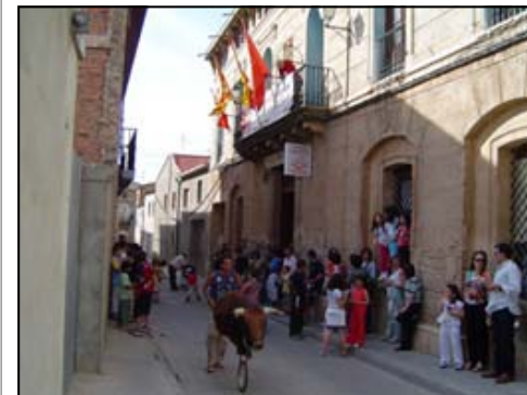
1 de mayo de 2005

Fiesta internacional dedicada al trabajador, día en el que los sindicatos