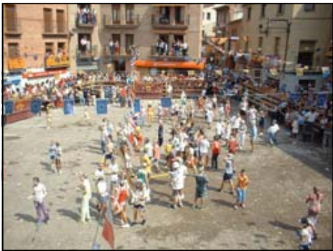
Explosión de alegría en el chupinazo

En Mallén se han perdido otras fiestas que también tenían lugar durante estas fechas que tratamos en este tríptico. De todas ellas, la más importante era la Feria, donde los agricultores, ganaderos y trabajadores de otros oficios ofrecían sus productos o incluso trataban entre ellos. Las ferias atraen a mucha gente de fuera, un ingrediente importante para unas buenas fiestas. Sin embargo, en otros pueblos sí se han conservado estas fiestas, que en su origen fueron totalmente paganas.