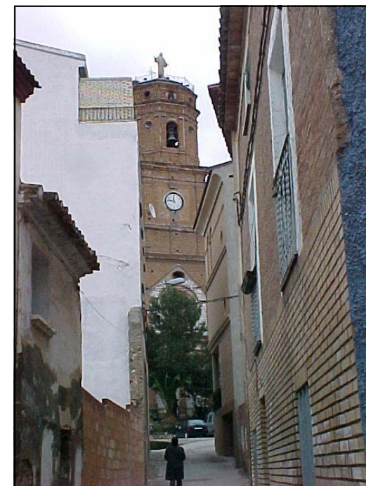
Calle Santa María

Como es habitual en casi todos los pueblos y ciudades, en el “centro” de la villa están inmersos la mayoría de los comercios y los locales de ocio de Mallén, especialmente en ese eje al que hemos aludido antes. El centro por el que discurre el bullicio de las fiestas y todo tipo de manifestaciones. Por otra parte, sus calles irregulares y desniveladas mantienen ese tipismo característico de lo antiguo, están cargadas de historia: casas blasonadas, hornacinas con imágenes religiosas, fachadas y aleros de diferentes épocas y estilos, y unos pocos palacios que nos transportan a la etapa señorial del Antiguo Régimen.