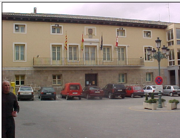
Ayuntamiento. Plaza España

La calle de San Andrés debe su nombre a la iglesia de la misma denominación que estuvo ubicada en la misma plaza, en la entrada de esa mis-