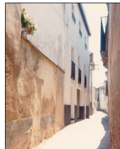
Calle del Molino. Años 70

P odíamos englobar bajo el concepto de casco antiguo o centro histórico a todas aquellas calles que configuran el entramado vial de Mallén en torno a la Plaza de España, y al eje central que suponen las calles Tudela y Virgen del Pilar (antigua calle Mayor). El barrio, que es tanto decir como la villa entera en los tiempos medievales, estuvo cercado de murallas en algún momento de la historia, y a él se accedía por sus dos puertas principales: la Puerta Nueva y la Puerta de Tudela.