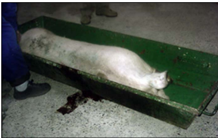
Bación usado en la matacía del cerdo

Ascla.- Astilla. Astral.- Ar. s.f. Hacha pequeña que se maneja con una sola mano. Atrapaciar.- v. Arreglar, vestir. Auco.- s.m. Oca. Aurora.- s.m. Canto religioso al amanecer. Aventar.- v. Lazar lejos, tirar. Aviar/se.- v. Arreglarse, vestirse. Avutardas.- s.m. Estar distraído, pensar en las ... Azacán.- adj. Persona que abarca muchos negocios para su propio provecho. Babi.- s.f. Bata. Babosa.- Ar. s.f. Cebolla añeja que se planta y produce otra. Molusco gasterópodo pulmonado, terrestre, sin concha, que cuando se arrastra deja como huella de su paso una abundante baba. Bachoca.- s.f. Judía que se recoge ya granada pero no seca. Bación.- s.m. Lugar donde se hace o se da la comida, principalmente a los cerdos, que además se usa para la matacía.