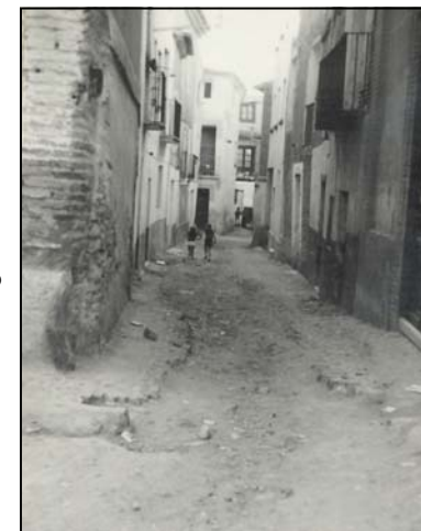
Calle San Andrés. Años 60

Dorador Eras España, Plaza Estación Extramuros Fuente, La Garcés General Franco Goya Huertos, Los Iglesia Iglesia, Plaza de la Juan Navarro Lechuga Mata (Manlia) Mazo, Juan Miraflores Molino Olmo Padre Ibáñez Paradero Pérez Calvillo Picolo Pilar, adyacente al (Magallón o Travesía) Portal, c/ A,B,C y D. Puentecilla (Bodegas) Ramón y Cajal, Santiago Rosario San Juan Trascastillos Vega Victoria Victoria, Travesía de Virgen del Carmen, c/ A y B. Virgen del Pilar Virgen del Puy, Paseo Viviendas Protegidas (B° del Puy) Yedra