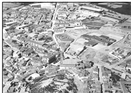
Mallén años 70

Bodegas Brun, Sancho Canal (Ramón de Pignate- lli) Cantón Carretera de Logroño Carretera de Zaragoza Castillo Cervantes Colorao (General Palafox) Coso Cruz, La Dama