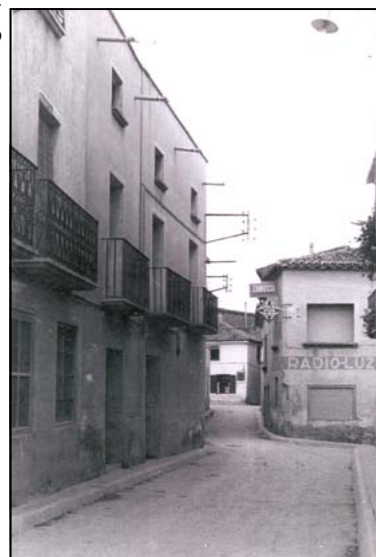
Calle El Pilar años 50

Dorador Eras España, Plaza Estación Extramuros Fuente, La Garcés General Franco Goya Huertos, Los Iglesia Iglesia, Plaza de la Juan Navarro Lechuga Mata (Manlia) Mazo, Juan Miraflores Molino Olmo Padre Ibáñez Paradero Pérez Calvillo Picolo Pilar, adyacente al (Magallón o Travesía) Portal, c/ A,B,C y D. Puentecilla (Bodegas) Ramón y Cajal, Santiago Rosario San Juan Trascastillos Vega Victoria Victoria, Travesía de Virgen del Carmen, c/ A y B. Virgen del Pilar Virgen del Puy, Paseo Viviendas Protegidas (B° del Puy) Yedra